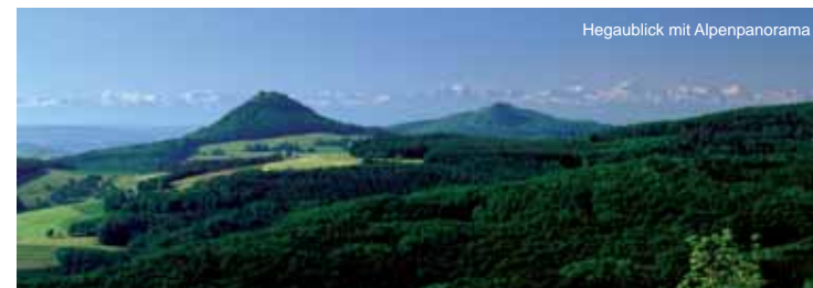
Hegaublick mit Alpenpanorama