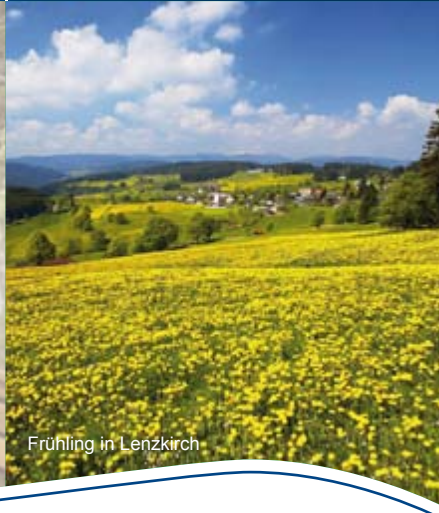
Frühling in Lenzkirch